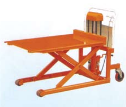
MHL05-JS (with platform)