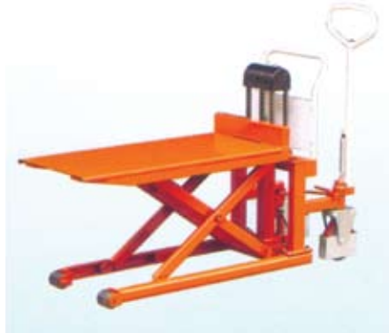
MHL10-JS (with platform)