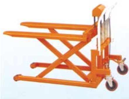
MHL05-JS (without platform)