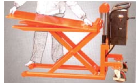
EHL10-JS (with platform)