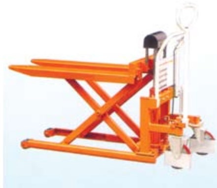
MHL10-JS (without platform)