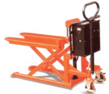
Power Unit Battery: 1.6Kw/12V EHL10-JS (without platform)